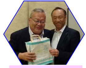
ブービーメーカー