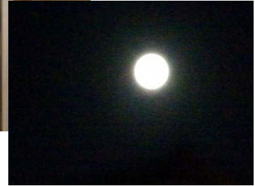
中秋の名月&すすき